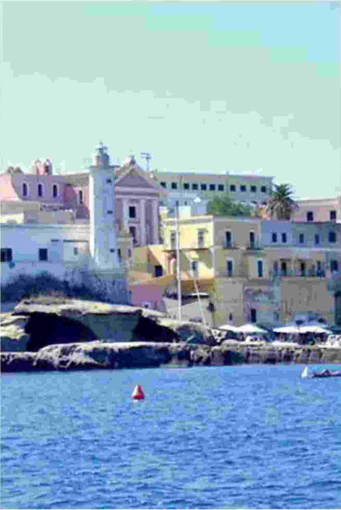
Veduta dal mare del porticciolo di Ventotene

Ritaglio stampa ad uso esclusivo del destinatario, non riproducibile.